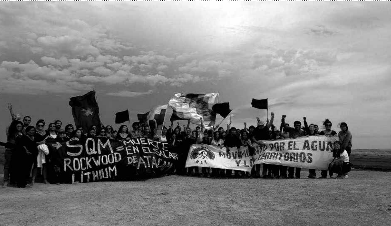
Movimiento por el agua y los territorios